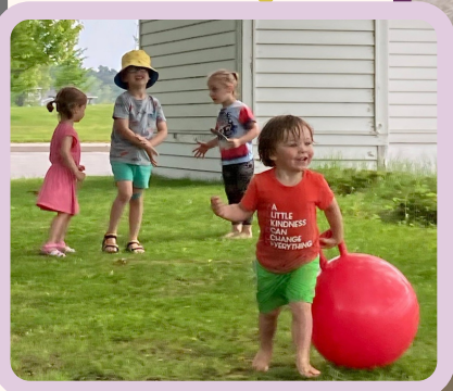
Diversión! En Los grupos de juego !!