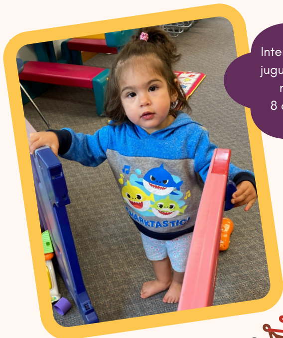
Intercambio de ropa y juguetes para bebés y niños pequeños 8 de junio de 2022